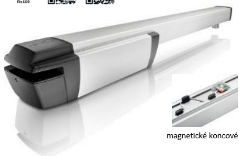
magnetické koncové dorazy